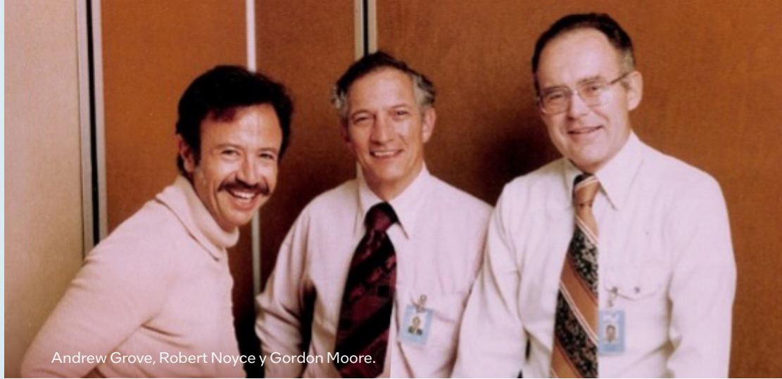
Andrew Grove, Robert Noyce y Gordon Moore.